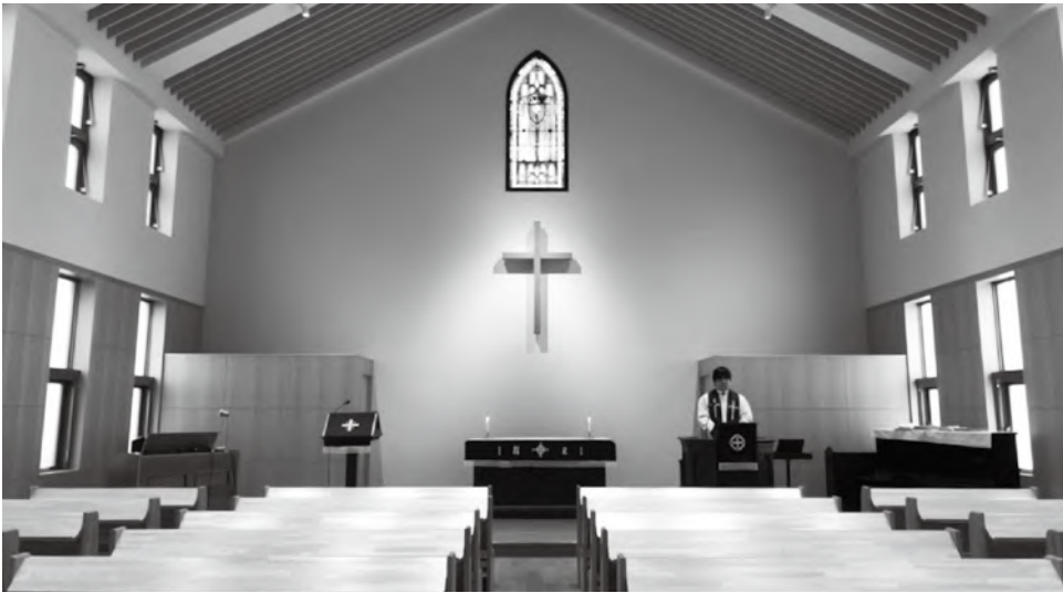
コロナ禍での無会衆オンライン配信中の礼拝堂 (日本福音ルーテル日吉教会)

ルター時代のペストのように、今、全世界がコロナに苦しんでいる。たとえば、治療薬やワクチンが開発されようが、世界は元には戻らない。言葉をかえて言えば、コロナ以前から潜在的に動き出していたものが、コロナによって顕在化するのである。たとえば、デジタル技術のうに。