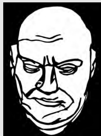
ルターのデスマスク 切り絵・竹田孝一

ルターは、一五四六年二月一八日に死んだ。六二才。場所は仕事のために訪れていたアイスレーベンであったが、それは偶然にも彼の生まれ故郷の町でもあった。